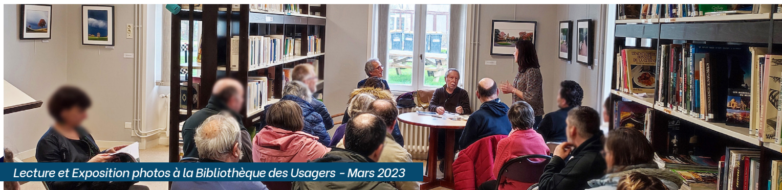
Lecture et Exposition photos à la Bibliothèque des Usagers - Mars 2023